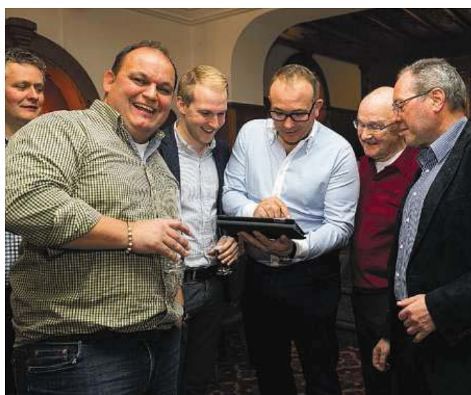
Gute Stimmung herrscht bei der Triesner VU-Ortsgruppe im Restaurant Schäfle.